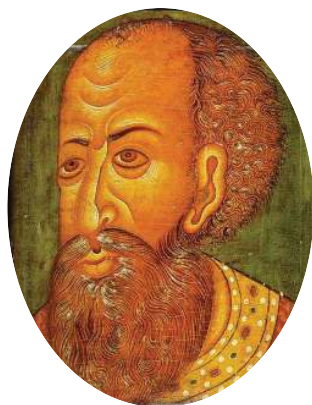
Царь Иван IV Грозный