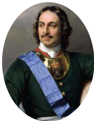
Император Петр I

Сообщениями «о похищении казны» первоначально занималась тайная канцелярия во главе с графом П.А. Толстым. И работала она на совесть. Но были и такие дворяне и чиновники, которые к проблеме мздоимства относились гораздо терпимее. По рассказам современников, однажды в Сенате Петр пригрозил издать указ, по которому всякий, кто украдет у казны сумму, на которую можно купить веревку, будет повешен. Генерал-прокурор Ягужинский на это заметил: «Неужели вы хотите остаться императором без служителей и подданных? Мы все воруют — с тем только различием, что один больше и приметнее, чем другой».