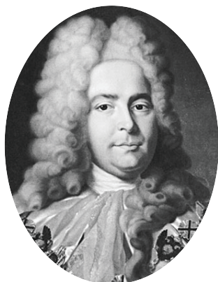
Генерал-прокурор Павел Иванович Ягужинский