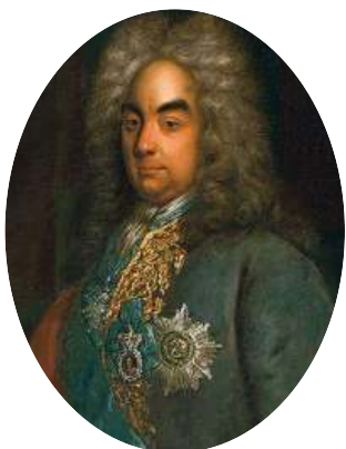
Петр Андреевич Толстой