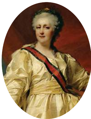
Императрица Екатерина II

В одном из циркуляров Наркомюста 1927 года предписывалось «в течение месяца повсеместно и одновременно назначить к слушанию по возможности исключительно дела о взяточничестве, оповестив об этом в газете, дабы создать по всей республике впечатление