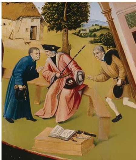
Фрагмент «Алчность» картины Иеронима Босха «Семь смертных грехов»

Рассматривая участников коррупции на примере взяточничества, стоит отметить, что в коррупционном процессе всегда участвуют две стороны. Одна сторона — это взяткополучатель (подкупаемый). Вторая сторона — это взяткодатель (осуществляющий подкуп). Также в процессе может участвовать и третья сторона — посредник.