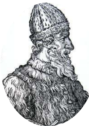
Великий князь Иван III

До XVIII века чиновники на Руси жили благодаря так называемым «кормлениям», то есть, при отсутствии оклада за исправление должности, разрешению на подношения от заинтересованных в их деятельности лиц. Одаривали их не только деньгами, но и «натурой» — мясом, рыбой, пирогами и пр., что было делом обыкновенным.