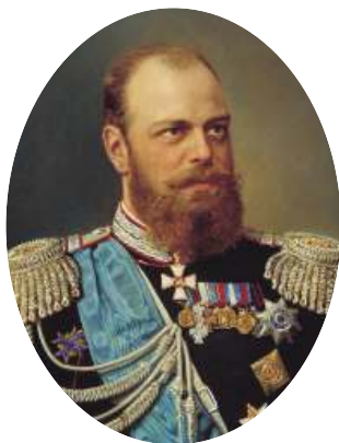
Император Александр III